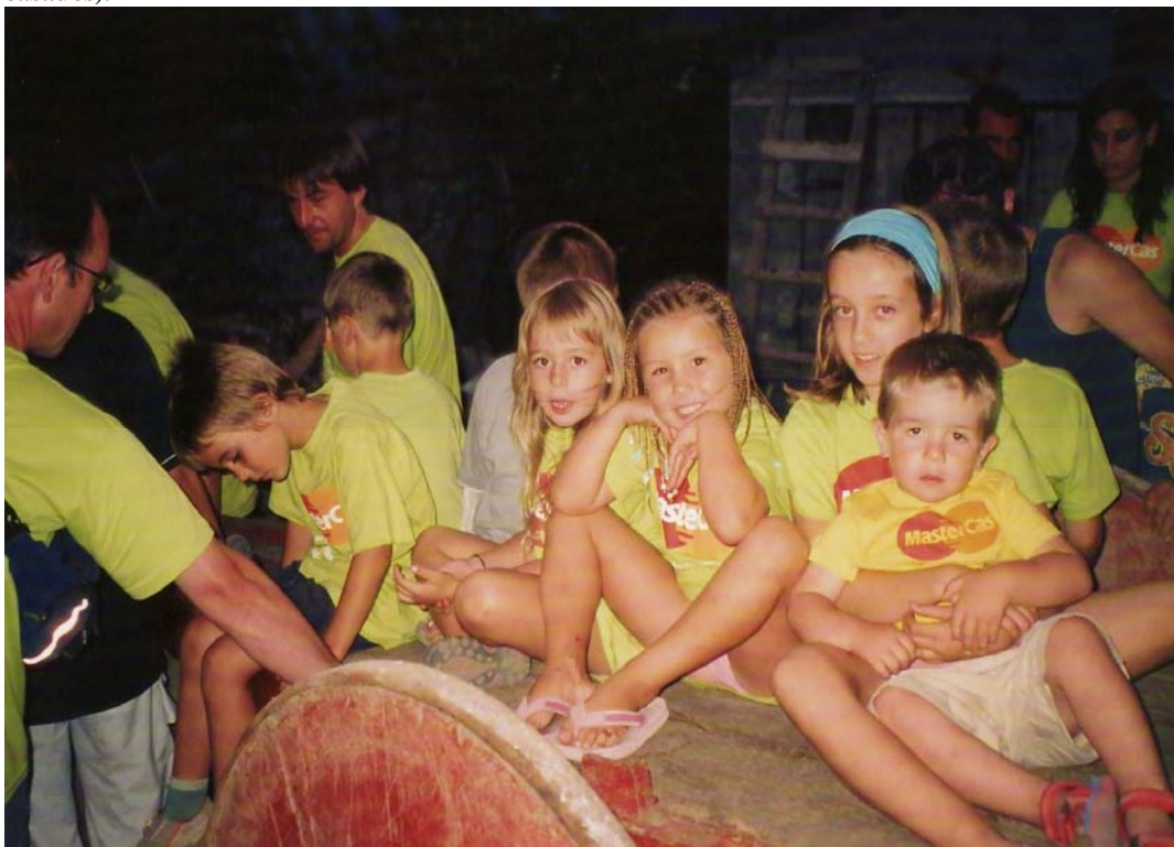
Foto.- Aquí temos os nenos subidos no carro o día 7 de Agosto.