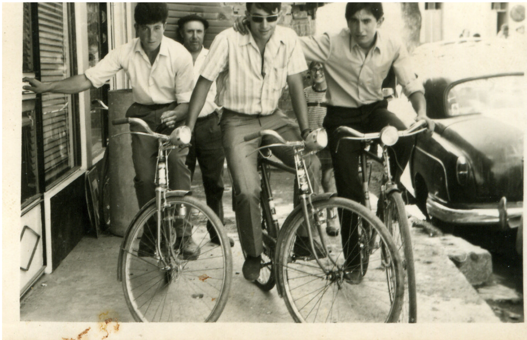
Foto. - Aquí temos fai uns poucos de anos estas xentes do pobo.